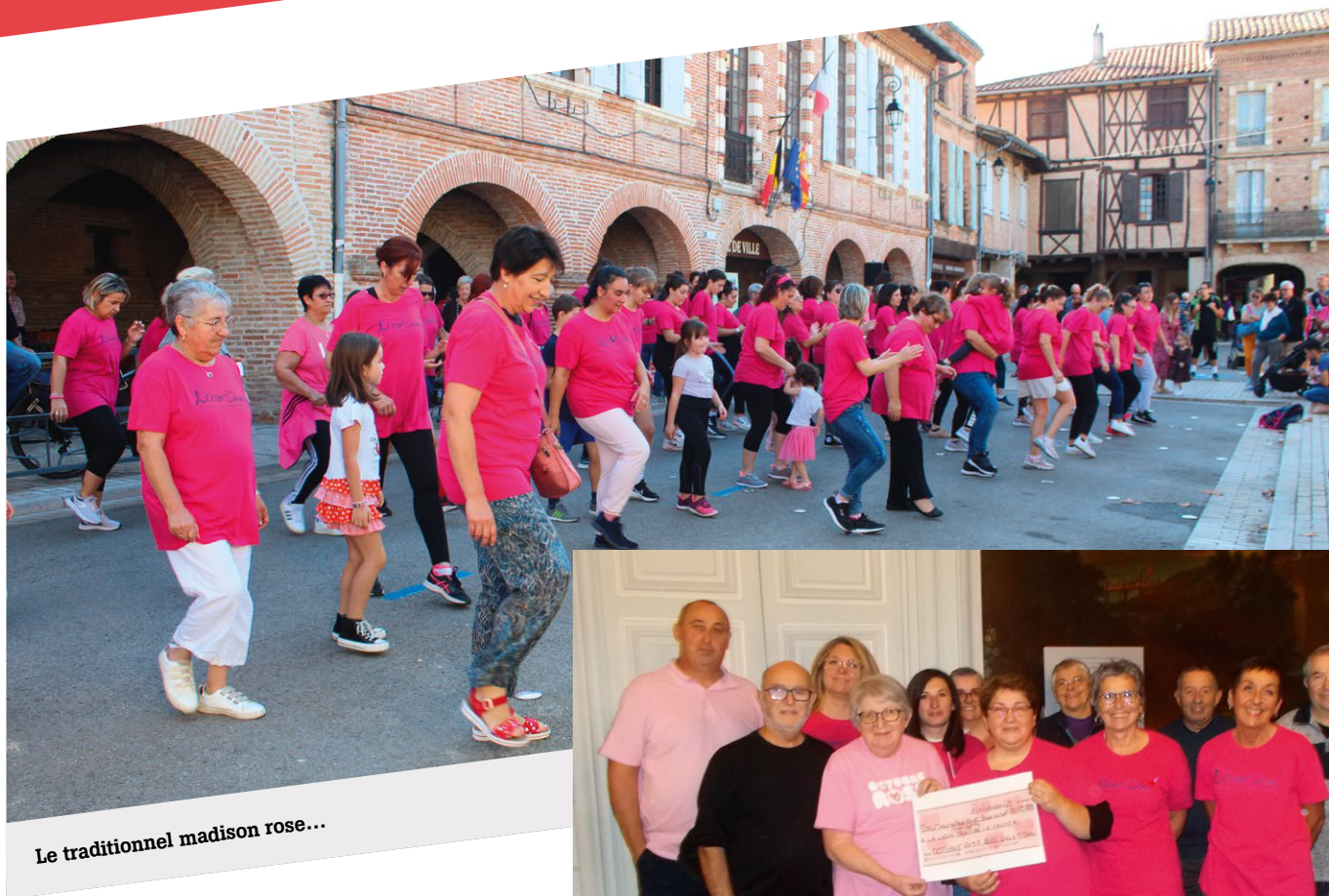
Le traditionnel madison rose...