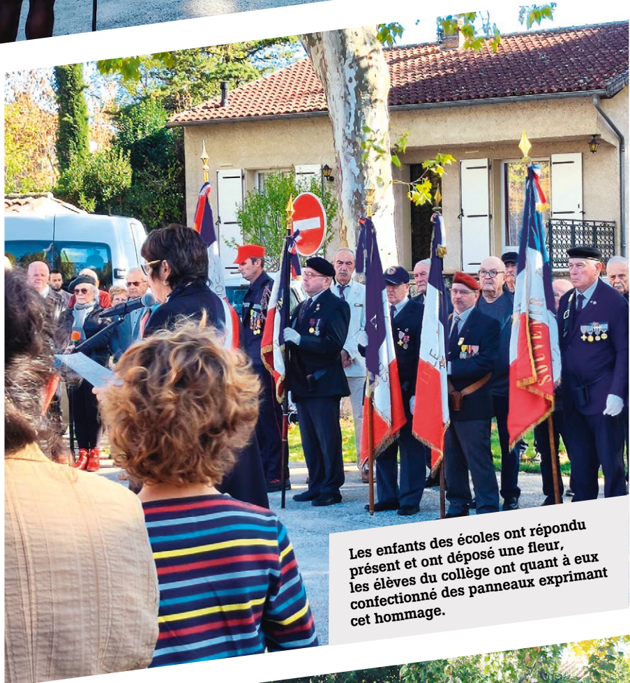
Les enfants des écoles ont répondu présent et ont déposé une fleur, les élèves du collège ont quant à eux confectionné des panneaux exprimant cet hommage.