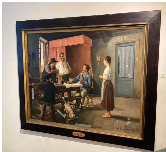
Exemples des actions de restauration d'œuvres et d'encadrement.

LA SCÉNOGRAPHIE : fait suite aux travaux du parcours muséal et à l'inventaire des œuvres exposables. Elle doit les mettre en scène, réaliser le mobilier professionnel utile, ajuster les éclairages dans le respect des normes