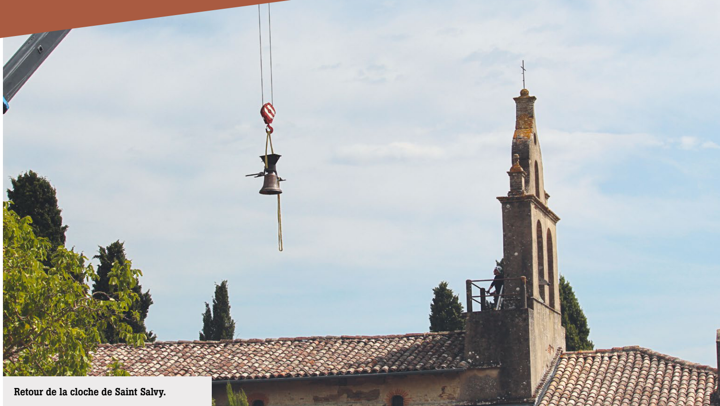
Retour de la cloche de Saint Salvy.