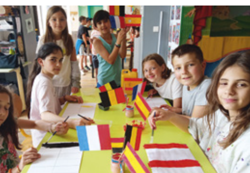
Confection de la décoration des tables par les enfants de l'ALAE.