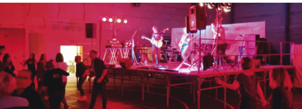
Soirée « Sainte Gisèle » organisée par les Grandes Fêtes.