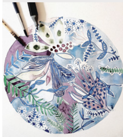
Œuvre commune aux 3 créatrices.

Sur RDV uniquement : Tél. : 06 64 03 28 30