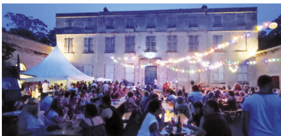
HOLÀ fait sa guinguette.

Le centre de secours de Lisle sur Tarn recrute !