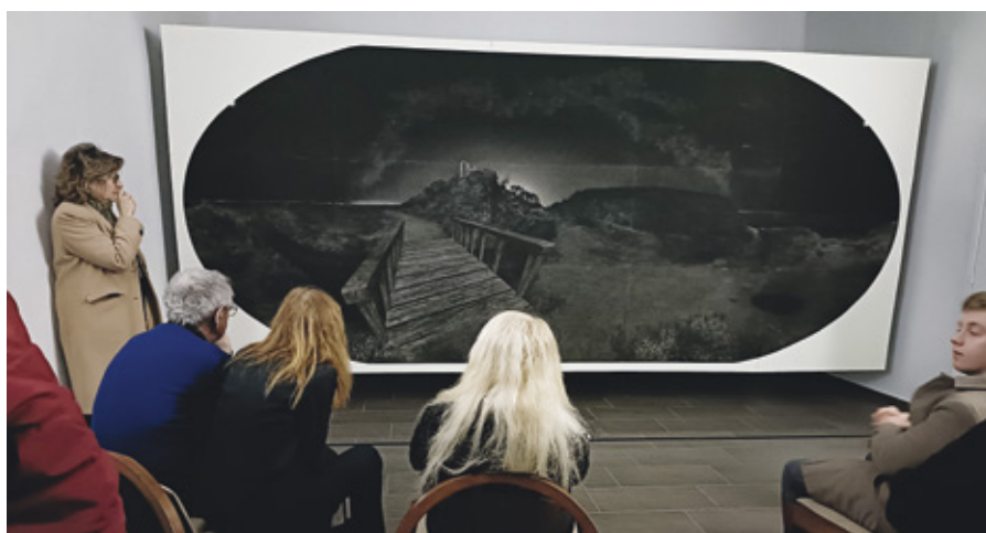
Mappemonde par Geneviève DÉMEURAU.