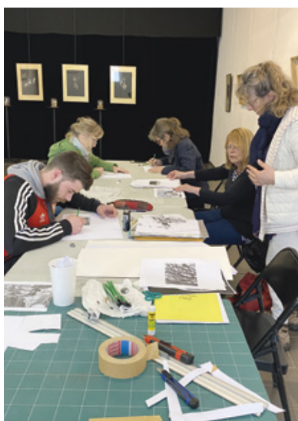
La fresque participative.