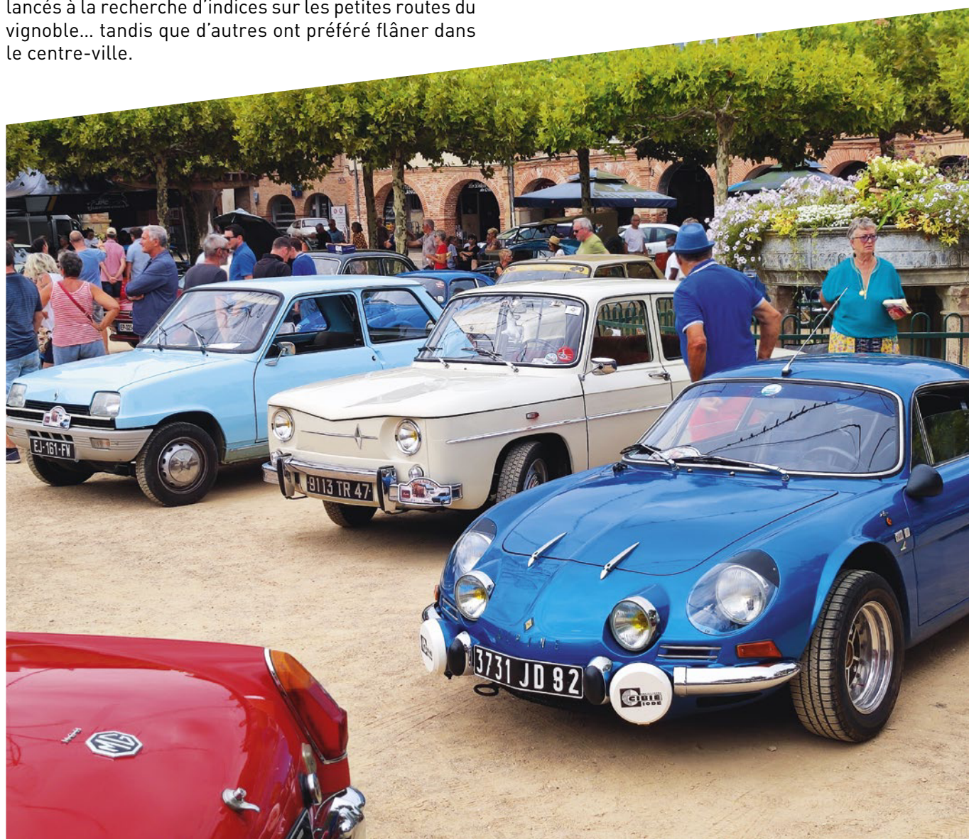
La R8 et l'Alpine A110 dont on fêtait les 60 ans, et la R5 dont on fêtait les 50 ans s'intègrent parfaitement à chaque décor.

De retour dans l'écrin de la place Paul Saissac, l'expo a ravi un public nombreux. Gageons qu'Occitania Auto Rétro ait eu raison du covid... En tout cas, le CAR Occitan prépare déjà l'édition 2023 qui devrait être encore plus gratinée.