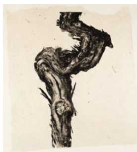
Théo JAN « cep de vigne tordu ».

Les travaux liés à la muséographie ont été menés à leur terme, ils déterminent le futur parcours muséal. Ceux en matière de scénographie sont en cours, ils réclament toute l'attention de l'équipe du musée, des techniciens et des élus référents pour mettre en valeur les richesses de notre patrimoine culturel par une mise en scène digne d'un musée du 21 e siècle.