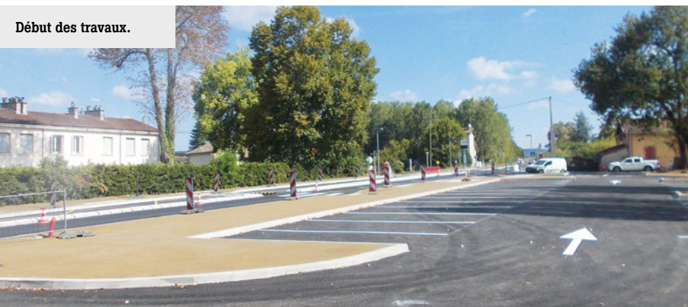
Début des travaux.

La municipalité de Lisle-sur-Tarn tient à féliciter et remercier le Maître d'œuvre, cabinet GETUDE et la société COLAS pour la qualité du travail réalisé dans un calendrier très restreint, ainsi que la Région et le Département qui ont soutenu techniquement et financièrement ce projet.