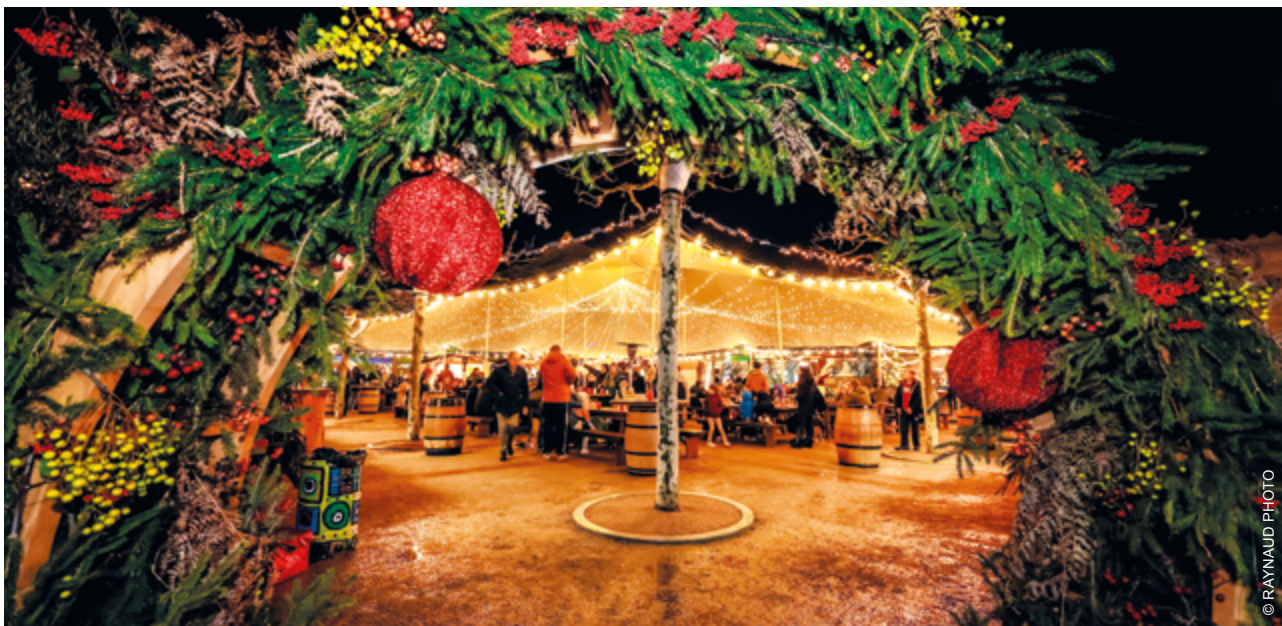
+ L'ENTRÉE DU VILLAGE DE NOËL