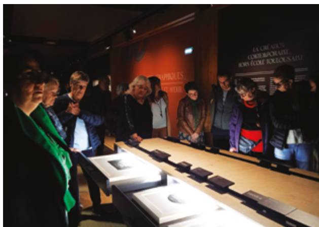
+ VISITE DU MUSÉE RAYMOND LAFAGE