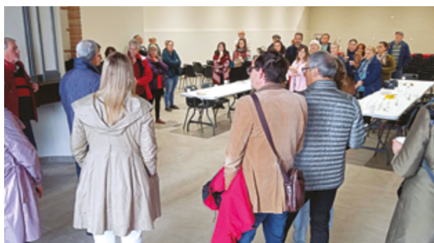
+ ACCUEIL À LA SALLE AGORA

Le prochain rendez-vous est fixé du 26 au 28 avril 2024 pour le championnat de France Handipêche.