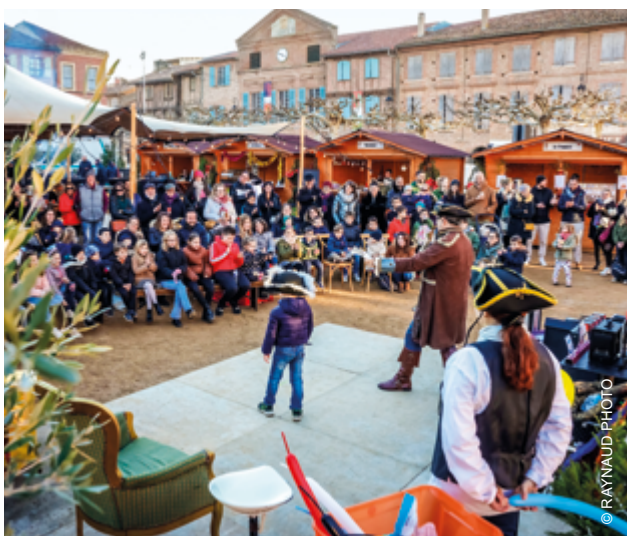
+ SPECTACLE DE MAGIE AVEC LES ENFANTS