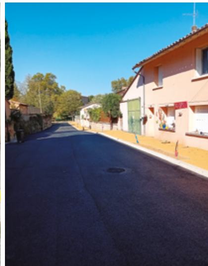
+ APRÈS LES TRAVAUX