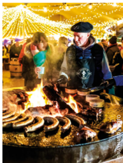
+ LE BRASERO