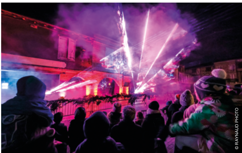
+ CONTE DE NOËL AVEC PROJECTION LUMINEUSE