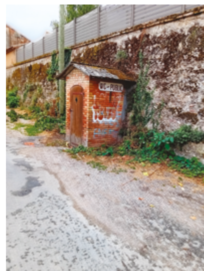
+ LE WC OBSOLETE, DÉGRADÉ ET SOURCE DE DÉPENSE D'EAU A ÉTÉ RETIRÉ