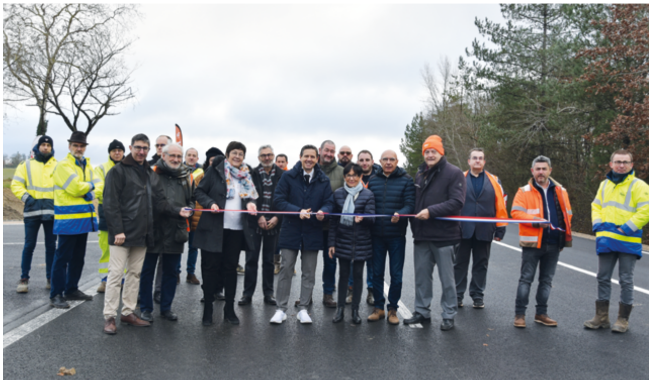
+ INAUGURATION LE 22 DÉCEMBRE PAR CHRISTOPHE RAMOND Président du Département du Tarn