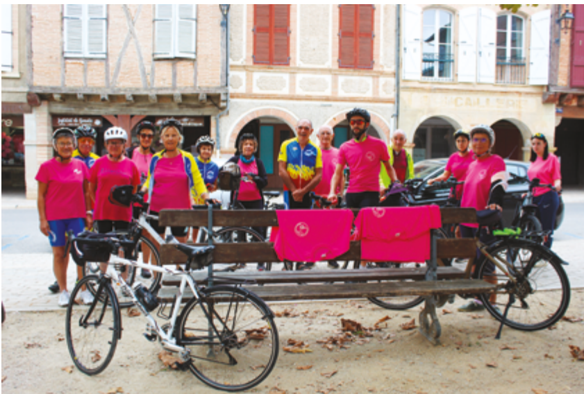
+ PARTICIPATION DE L'ASSOCIATION « LES DÉJANTÉS » POUR UNE BALADE À VÉLO

Un grand « MERCI » aux participants anciens et nouveaux, aux associations et aux bénévoles qui ont permis que cette édition soit encore une réussite.