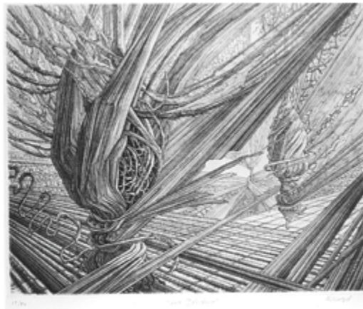
LES DEVIDOIRS - THE SPINDLE EAU FORTE - ETCHING 19 x 23 cm - 7,41" x 8,97"