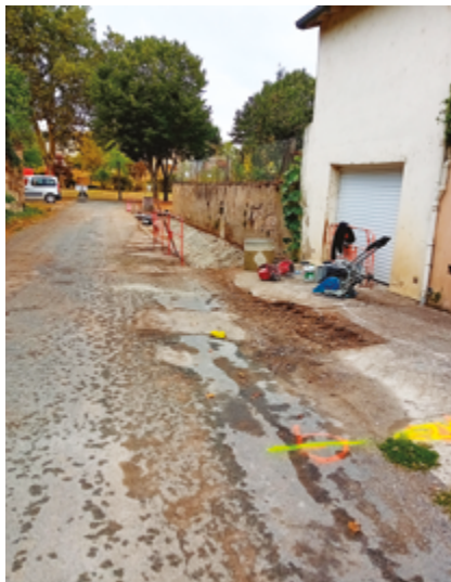
+ PENDANT LES TRAVAUX

Les travaux rue des Promenades sont eux aussi terminés. Un aménagement paysager a été mis en place tout au long du passage piéton créé côté gauche de la chaussée dans le sens Les Promenades- avenue Jules FERRY et au niveau du 1 avenue Jules FERRY. Les deux places de stationnement « médecins » sont maintenues dans le haut de la rue. Dans l'attente d'un retour d'expérience l'organisation du stationnement dans cette rue est laissée à la discrétion des riverains sans marquage au sol. Au vu des observations le double sens de circulation peut y être maintenu, toutefois il est recommandé d'y circuler à vitesse réduite.