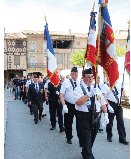
+ DÉPART DU CORTÈGE