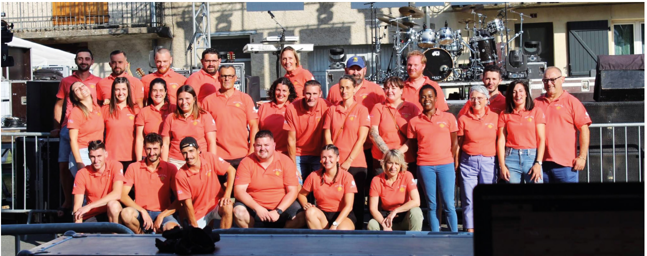
+ L'ÉQUIPE DES BÉNÉVOLES