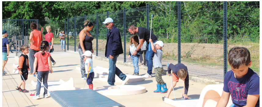
+ LE MINI GOLF FAIT DES ADEPTES