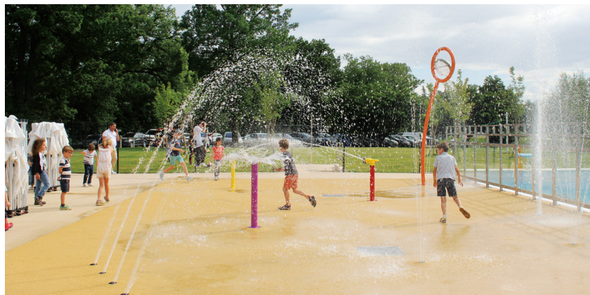
+ MÊME HABILLÉS, LES ENFANTS ONT PRIS D'ASSAUT LE NOUVEL ESPACE