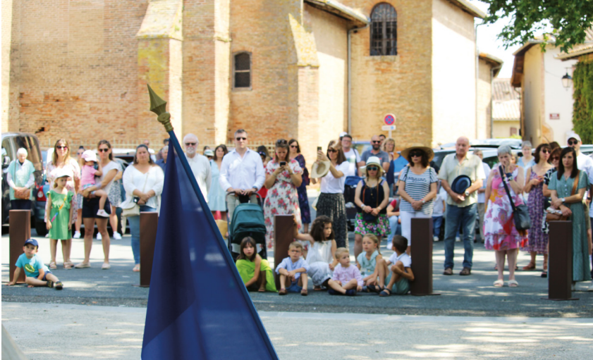
+ LA CÉRÉMONIE AVEC DÉPÔT DE GERBES AU MONUMENT AUX MORTS A ÉTÉ HONORÉE PAR DE NOMBREUX LISLOIS