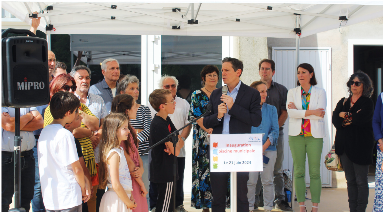
+ PRISE DE PAROLE DE CHRISTOPHE RAMOND - PRÉSIDENT DU CONSEIL DÉPARTEMENTAL DU TARN

Construite en 1974 (année de la mise en eau du lac de Bellevue) sous la première mandature de Pierre CAYLA, la piscine municipale se présente aujourd'hui dans sa nouvelle configuration.