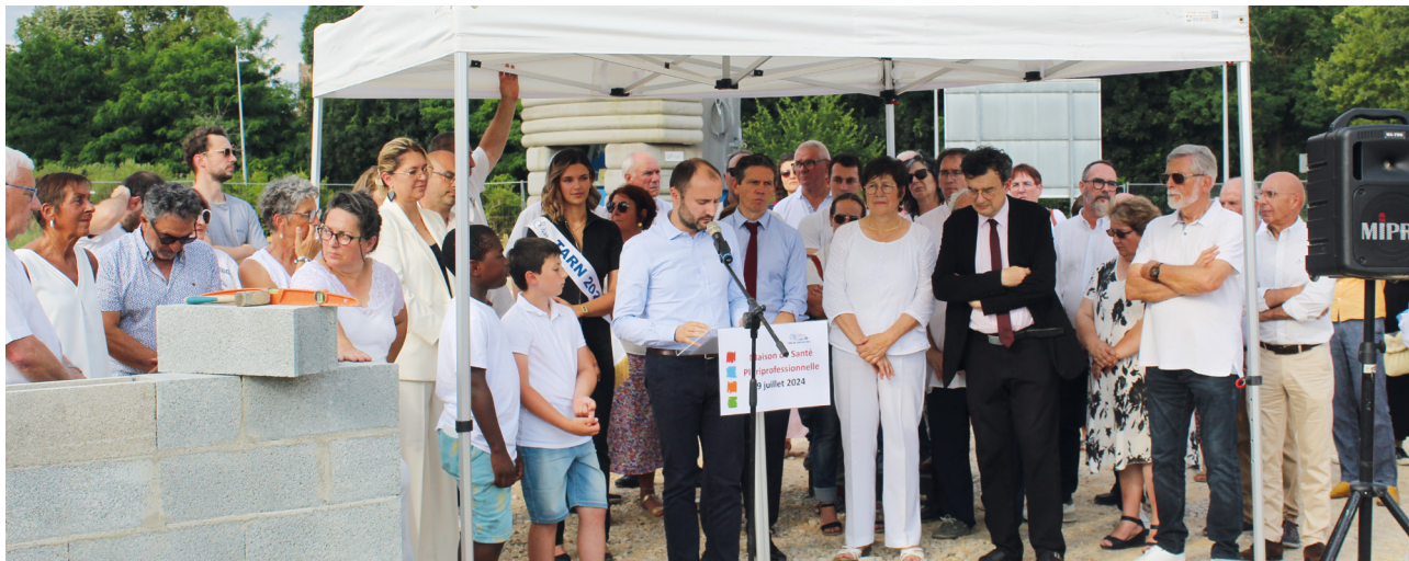
+ PRISE DE PAROLE PAR SÉBASTIEN SIMOES – SECRÉTAIRE GÉNÉRAL ET SOUS-PRÉFET DU TARN