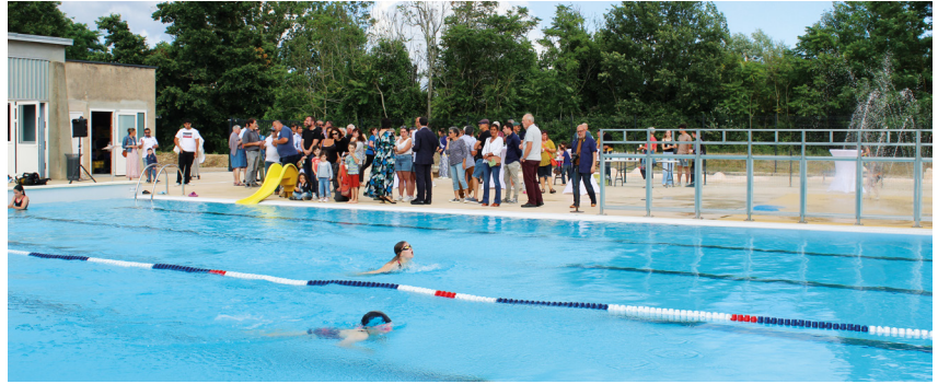
+ LE CLUB DE PLONGÉE BUBBLE DIVE A PROPOSÉ DES PRÉSENTATIONS DE NATATION ET DE PLONGÉE. DES STAGES DE PLONGÉE ET INITIATIONS SONT PROPOSÉS À LA PISCINE PAR CE CLUB