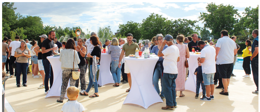
+ ET ENFIN, MOMENT D'ÉCHANGES AUTOUR DU VERRE DE L'AMITIÉ

LE SUCCÈS DE LA PISCINE EN CHIFFRES : NOMBRE D'ENTRÉES JUILLET ET AOÛT 2024 :